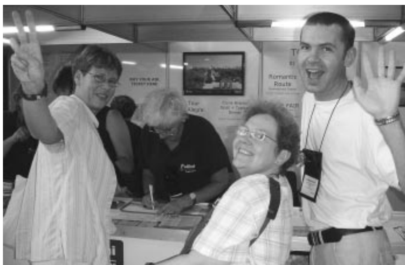
FORUM delegatie bij WCC in Porto Alegre, Brazilië

P.s. Bij dit nummer de jaarlijkse acceptgiro. Bewijs een vriend(inn)endienst door snel te betalen.